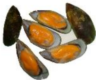
Małże w skorupach