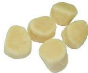
Mięso z małży św. Jakuba